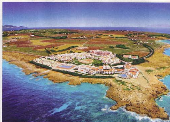
Sotto, il villaggio di Favignana nelle isole Egadi