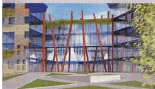
Sopra, la nuova sede Ibm Italia a Segrate (Milano) in fase di realizzazione

me partner tecnologico per le Pmi, facendo leva sulle competenze, l'esperienza e la presenza locale dei partner; 4 integrare prodotti e servizi con quelli dei partner per offrire ai clienti le migliori soluzioni possibili; 5 promuovere le soluzioni d'Information technology più innovative attraverso iniziative di marketing mirate, con l'obiettivo di creare nuova domanda e identificare opportunità di business per i partner; 6 aggiornare costantemente i programmi dei partner, costruendo iniziative e campagne sulla base delle esigenze provenienti dal mercato.